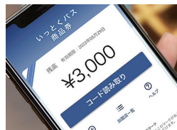
飲食店デジタルチケット