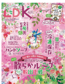
LDK the beauty