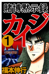
賭博黙示録カイジ