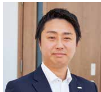
関西住宅販売株式会社 神戸支店 販売課 主任