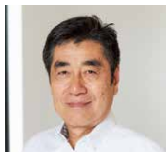
株式会社ヴァイスプランニング 一級建築士