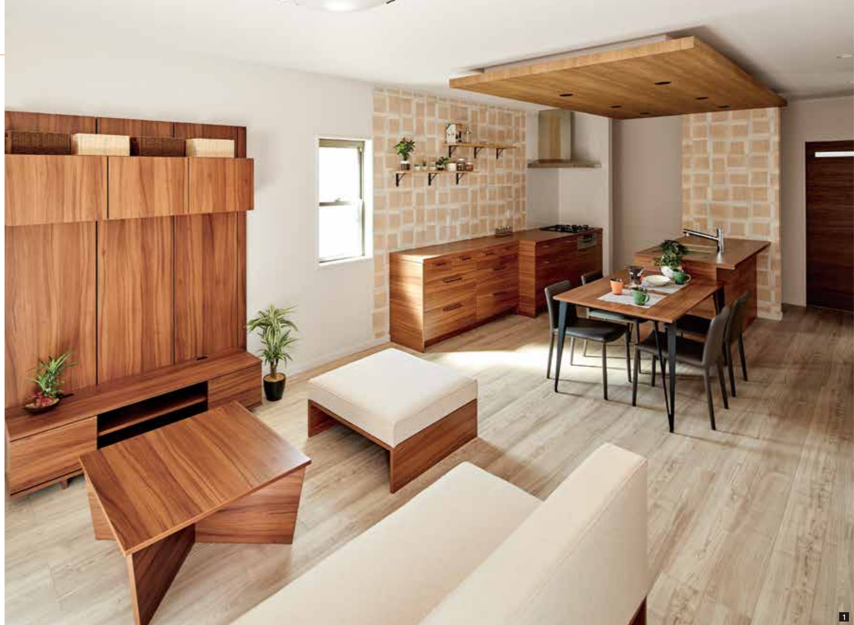
1 「ダブル発電」を標準装備し