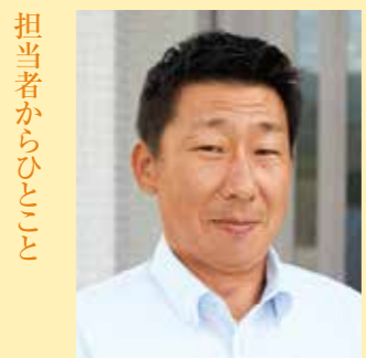
担当者からひとこと